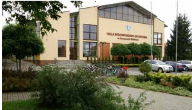
Hala widowiskowo-sportowa w Koszycach Wielkich

Dużą uwagę gminny samorząd przykładą do jakości edukacji. W szkołach kilkakrotnie realizowane były programy edukacyjne w ramach pozyskanych środków unijnych z Programu Operacyjnego Kapitał Ludzki – łącznie na kwotę blisko 4 milionów złotych. Natomiast dzięki współpracy