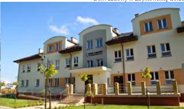
Przedszkole w Zgłobicach