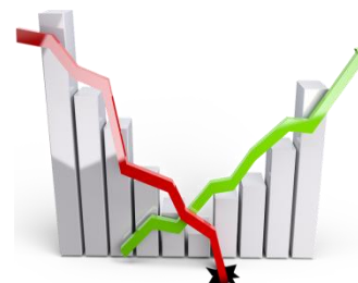
Tabela Nr 2. Napływ i odpływ bezrobotnych w latach 2016-2017

Dynamika bezrobocia zależy od liczby osób rejestrujących się jako bezrobotne w danym roku (tzw. napływ) oraz liczby osób tracących status bezrobotnego w tym samym okresie (tzw. odpływ). W skali roku 2017 w powiecie nidzickim zaobserwowano ujemną dynamikę bezrobocia, podobnie jak w roku poprzednim.